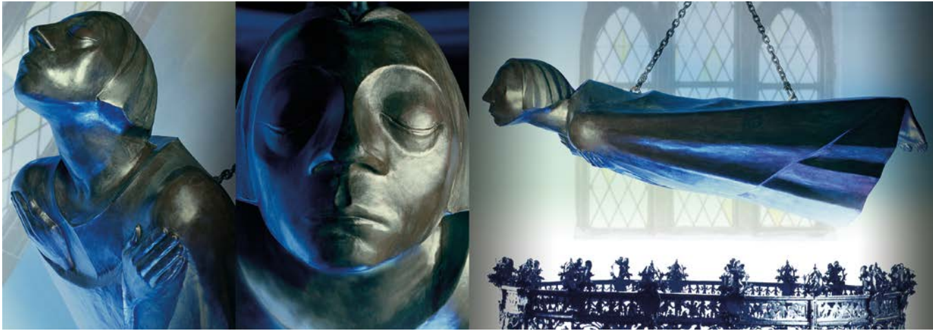
Ernst Barlach, Güstrower Engel, Stukko nach der Bronze von 1927

Schon zu Lebzeiten wurden Käthe Kollwitz (1867-1945), und Ernst Barlach (1870-1938) zusammen in den Ausstellungen der Berliner Secession gezeigt, in deren Gremien sie seit 1912 gemeinsam tätig waren. Der Verleger und Kunsthändler Paul Cassirer ließ ihre Gesamtausstellungen 1917, für Barlach die erste große Werkschau, zeitlich direkt aufeinanderfolgen. Von den Nationalsozialisten als »antideutsch« und »entartet« verunglimpft, wurden große deutsche Sammlungen expressionistischer Kunst ab 1935 ins europäische Ausland und in die USA verbracht, darunter auch zahlreiche Arbeiten von Barlach und Kollwitz.