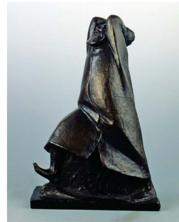
Ernst Barlach, Der Ekstatiker, Bronze, 1911-1912

lerische Muttersprache“. Jedoch löste er sie nach und nach von jeglicher Individualität und fand in der all-gemeingültigen Gebärde den Ausdruck des metaphysischen Seins. Im zutiefst Menschlichen zeigte sich für ihn »das Geistige«, das die Welt im Zuge ihrer Modernisierung zu verlieren drohte. Barlach wollte Kunstwerke schaffen, die Einfluss nahmen auf die kollektive geistige Verfassung. Er verlangte nicht »Erbauung und Befreiung« vom Kunstwerk: „Ein Wort gegen etwas für etwas Besseres gesagt zu haben oder vielmehr etwas in Erinnerung gebracht zu haben, das im Trubel des Daseins zu leicht vergessen wird“ sah er als seine künstlerische Aufgabe. Er trat den Erschütterungen seiner Zeit mit einer symbolisch-expressionistischen Bildsprache entgegen, die auf eine übergeordnete Raum- und Zeitebene verweist.