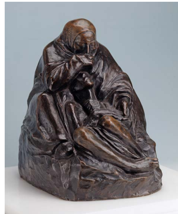
Käthe Kollwitz, Pietà, Bronze, 1936

lerische Muttersprache“. Jedoch löste er sie nach und nach von jeglicher Individualität und fand in der all-gemeingültigen Gebärde den Ausdruck des metaphysischen Seins. Im zutiefst Menschlichen zeigte sich für ihn »das Geistige«, das die Welt im Zuge ihrer Modernisierung zu verlieren drohte. Barlach wollte Kunstwerke schaffen, die Einfluss nahmen auf die kollektive geistige Verfassung. Er verlangte nicht »Erbauung und Befreiung« vom Kunstwerk: „Ein Wort gegen etwas für etwas Besseres gesagt zu haben oder vielmehr etwas in Erinnerung gebracht zu haben, das im Trubel des Daseins zu leicht vergessen wird“ sah er als seine künstlerische Aufgabe. Er trat den Erschütterungen seiner Zeit mit einer symbolisch-expressionistischen Bildsprache entgegen, die auf eine übergeordnete Raum- und Zeitebene verweist.