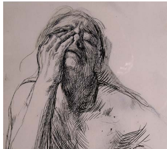
Käthe Kollwitz, Frau mit schmerzverzerrtem Gesicht , Feder, 1900

Ernst Barlach formulierte seine Grundgedanken im Angesicht des Leidens und in der Klage um die Toten des Krieges und damit vor allem in Ausdrucksformen monumentaler Plastik. In einer fortschreitend aus den bekannten Bahnen drängenden Zeit, in der die Künstler in der Überzahl den schönen Schein bedienten und dabei ihre zunehmende Sinnentleerung nicht verbergen konnten oder vielleicht gerade deshalb mit widersprüchlichen, unrealen utopischen Gegenentwürfen aufwarteten, fühlte sich Käthe Kollwitz in Barlachs Gegenwart noch am wenigsten fremd. Aus welchen Motiven und Gelegenheiten sich ihre künstlerischen