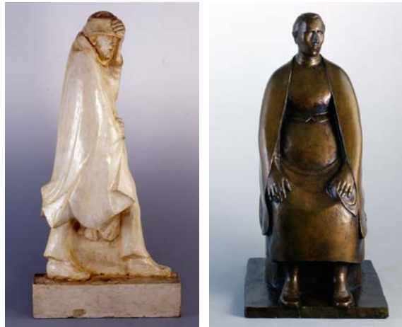
Ernst Barlach, Wanderer im Wind , Stukkoguß, 1934 Ernst Barlach, Trauer , Bronze, 1913

einer über den Zustand der Welt hinauswollenden geistigen Orientierung. In Barlachs Schaffen aber nimmt die Kritik des Materialismus in der modernen Welt einen so dezidierten Stellenwert ein, dass auch seine Position als gesellschaftlich engagierter Künstler außer Frage steht. Ist das Werk der Käthe Kollwitz auf den ersten Blick bestimmt von der Darstellung materieller Grenzen der Existenz, so visualisieren die Figuren von Ernst Barlach das über die Grenzen Hinauswollende. Beide freilich sahen die Aufgabe ihrer Kunst darin, die Welt aus einem tiefen humanistischen Verständnis heraus zu verändern.