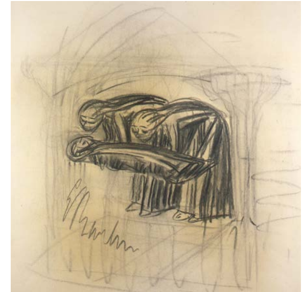
Ernst Barlach, Grablegung, Kohle, 1927

Die vergleichende Ausstellung „Ernst Barlach – Käthe Kollwitz – Über die Grenzen der Existenz“ will zum Überdenken der Bilder anregen, die von beiden Künstlern im Umlauf sind. Was die Ausstellung festzuhalten versucht, ist keine letztendliche Bestimmung der Berührung zweier Künstler, sondern sie sollte auch als etwas im Fluss Befindliches verstanden werden, das im Vorfeld zu erwartender neuer wissenschaftlicher Untersuchungen über das künstlerische Beziehungsgeflecht zwischen Ernst Barlach und Käthe Kollwitz liegt.